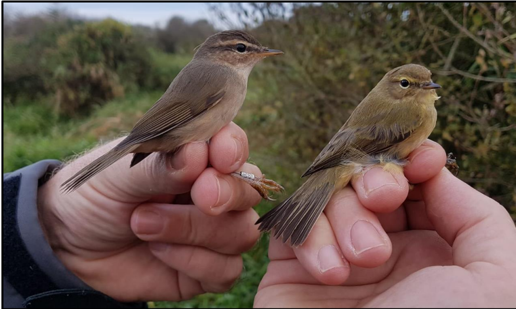
Pouillot brun ( Phylloscopus fuscatus ) à gauche – Saint-Philbert-de-Grand-Lieu / Loire-Atlantique (44)