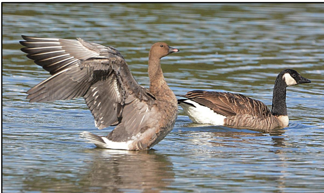
Oie à bec court ( Anser brachyrhynchus ) – Langoëlan / Morbihan (56) (© J.-Y. Nicolas)

L'individu observé depuis le 25/09 à la Grande Noë / Val-de-Reuil (27) est revu jusqu'au 31/10 au moins ; les 3 oiseaux (phot.) observés précédemment sur Ouessant (29) y sont notés jusqu'au 07/10 ; 1 1A (phot.) le 16/10 puis deux (phot.) à partir du 27/10 – individus domestiques - à l'étang du Dordu / Langoëlan (56) (J.-Y. Nicolas) ; 1 (phot.) le 28/10 à l'Emprunt du site de Chantecoq / Giffaumont-Champaubert (51) (W. Guillet).