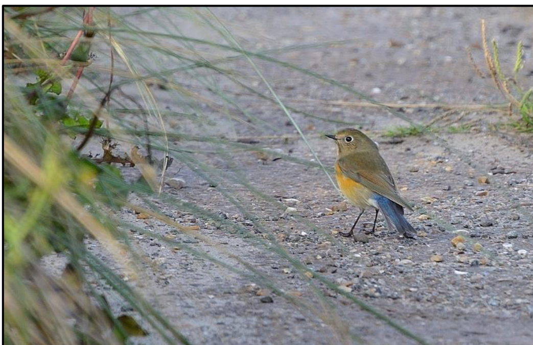
Robin à flancs roux ( Tarsiger cyanurus ) – Grande-Synthe / Nord (59)

1 1A (phot.) le 08/10 sur la digue du Braek / Grande-Synthe (59) (M. Roca et al. ) et 1 1A (phot.) ce même jour trouvé à la Capitainerie du Grand Maritime de Dunkerque (59) et observé jusqu'au 14/10 (D. Haubreux et al. ).