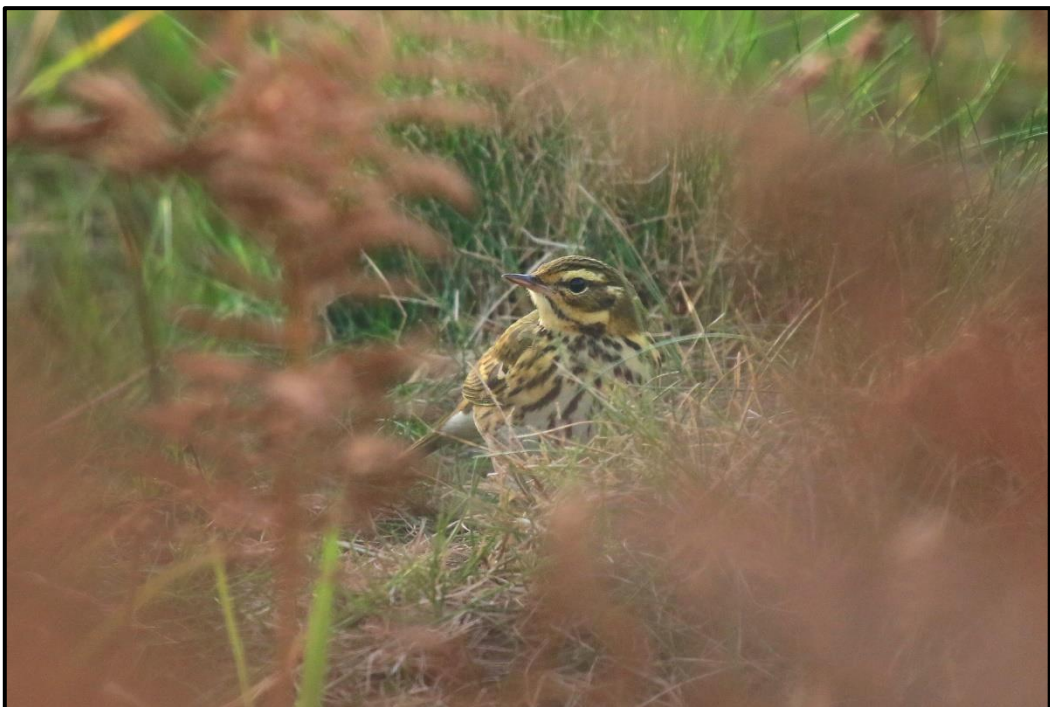
Pipit à dos olive ( Anthus hodgsoni ) – Cost Ar Reun Ouessant / Finistère (29)

Bergeronnette de Béringie ( Motacilla tschutschensis ) Eastern Yellow Wagtail :