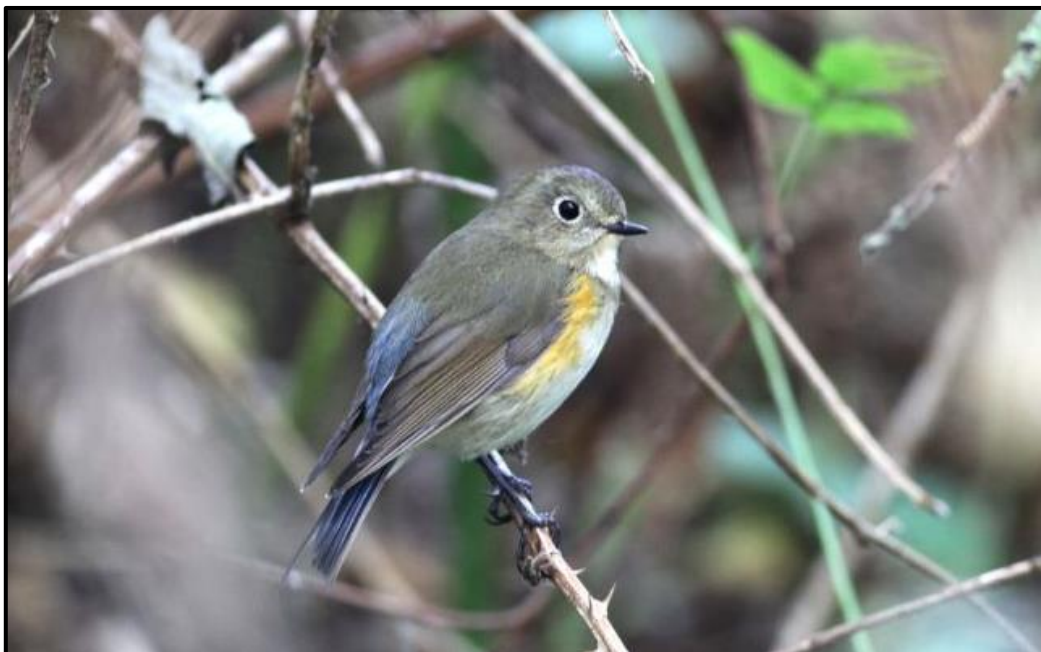
Robin à flancs roux ( Tarsiger cyanurus ) – Dunkerque / Nord (59)

1 1A le 06/10 au parc du vent / Dunkerque (59) (S. Chanel & V. Dourlens) ; 1 1A (phot.) le 08/10 à Keranchas / Ouessant (29) (N. Issa et al. ) revue le 09/10 à Stang Yusin / Ouessant (29) (J. Renoult et al. ) ; 1 1A (phot.) les 19 et 20/10 sur l'île de Molène (29) (P. Le Maréchal, A. De Broyer et al. ) ; 1 1A (phot.) le 21/10 à Cayeux-sur-Mer (80) (A. Reboul & V. Condal).