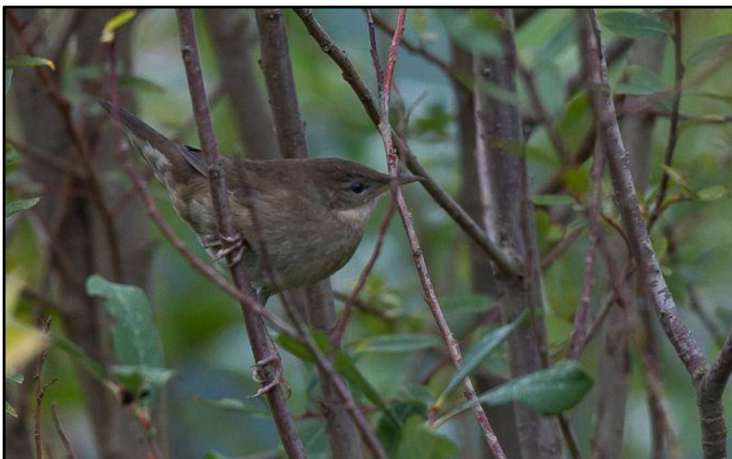
Locustelle fluviatile ( Locustella fluviatilis ) – Arnas / Rhône (69)

1 1A (phot.) du 8 au 13/10 au Pré de Joux / Arnas (69) (G. Corsand et al. )