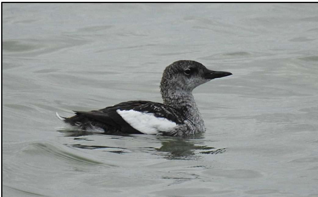
Guillemot à miroir ( Cepphus grylle ) – Concarneau / Finistère (29)

2 oiseaux de premières années ensemble (phot. et enregistrés) à partir du 18/10 (H. Touzé, R. Seitre, S. Havet et al. ) rejoint par un troisième individu le 21/10 uniquement (F. Veyrunes, J. Renoult et al. ) puis au minimum un seul du 25 au 29/10 à Porz Doun / Ouessant (29). Effectif exceptionnel en Europe de l'ouest, les oiseaux cantonnés sur un secteur restreint auront permis de belles observations en compagnie parfois directe de bruants lapons et d'un Pipit à gorge rousse.