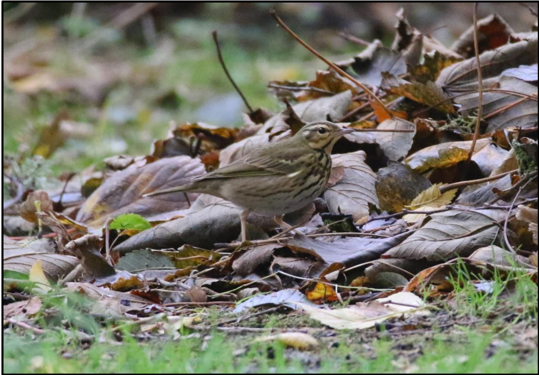
Pipit à dos olive ( Anthus hodgsoni ) – Kernigou Ouessant / Finistère (29)