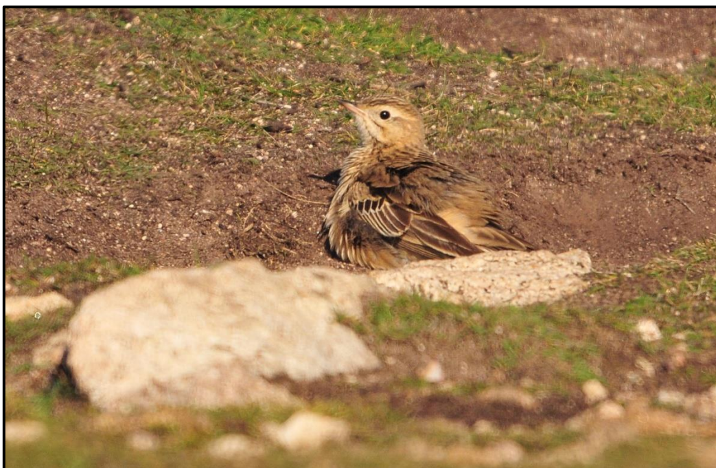
Pipit de Godlewski ( Anthus godlewski ) Individu n°2 – Ouessant / Finistère (29)

1 (enregistré) le 13/10 à Lège-Cap-Ferret (33) (S. Wroza) ; 1 trouvé le 13/10 à Ty Crenn puis retrouvé (phot. et enregistré) le 14/10 à Kernigou / Ouessant (29) (J. Renoult et al. ) ; 1 (enregistré) le 14/10 à Lège-Cap-Ferret (33) (S. Wroza & P. Legay) ; 1 (phot. et enregistré.) les 23 et 24/10 à l'ouest de Cost Ar Reun / Ouessant (29) (J. Bottinelli et al. ).