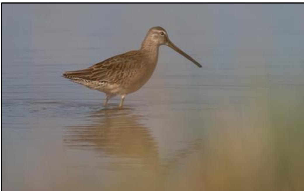
Bécassin à long bec ( Limnodromus scolopaceus ) – Moëze / Charente-Maritime (17)

1 1A (phot.) du 20 au 22/10 dans la Réserve Naturelle Nationale de Moëze / Moëze (17) (D. Robin et al. ).