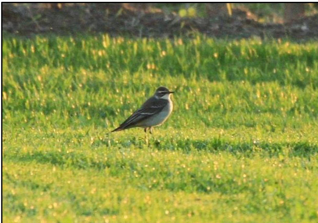
Probable Bergeronnette de Béringie ( Motacilla tschutschensis ) – Sauzon / Morbihan (56)

1 1A (phot.) le 08/10 sur la digue du Braek / Grande-Synthe (59) (M. Roca et al. ) et 1 1A (phot.) ce même jour trouvé à la Capitainerie du Grand Maritime de Dunkerque (59) et observé jusqu'au 14/10 (D. Haubreux et al. ).