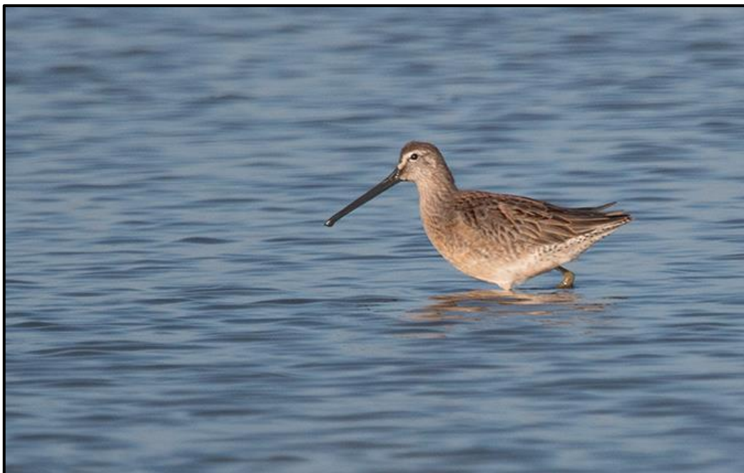
Bécassin à long bec ( Limnodromus scolopaceus ) – Moëze / Charente-Maritime (17)

1 adulte (phot.) du 15 au 20/10 à proximité de l'Île Txingudy / Hendaye (64) (J.-F. Esparcia et al. ).