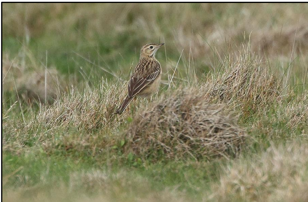
Pipit de Godlewski ( Anthus godlewski ) Individu n°1 – Ouessant / Finistère (29)