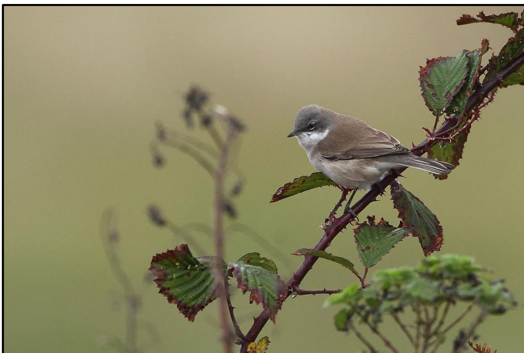
Fauvette babillarde orientale ( Sylvia curruca blythi ) – Marais du Kun Ouessant / Finistère (29)