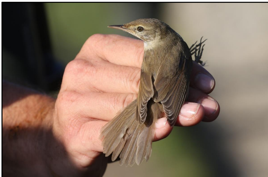
Rousserolle des buissons ( Acrocephalus dumetorum ) – Ouessant / Finistère (29)

1 1A (phot.) capturée et baguée le 06/10 au Fort Vert / Marck (62) (F. Schneider et al. ) ; 1 1A (phot.) le 09/10 trouvée par C. Morvan puis capturée et baguée par W. Raitière et al. à la Chapelle Notre Dame de Bon Voyage / Ouessant (29) ; 1 (phot.) le 19/10 à Loqueltas / Ouessant (29) (F. Bouzendorf, S. Vincent et al. ).