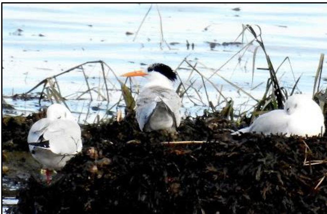
Sterne voyageuse ( Sterna bengalensis ) – Hendaye / Pyrénées Atlantiques (64)

1 adulte (phot.) du 15 au 20/10 à proximité de l'Île Txingudy / Hendaye (64) (J.-F. Esparcia et al. ).