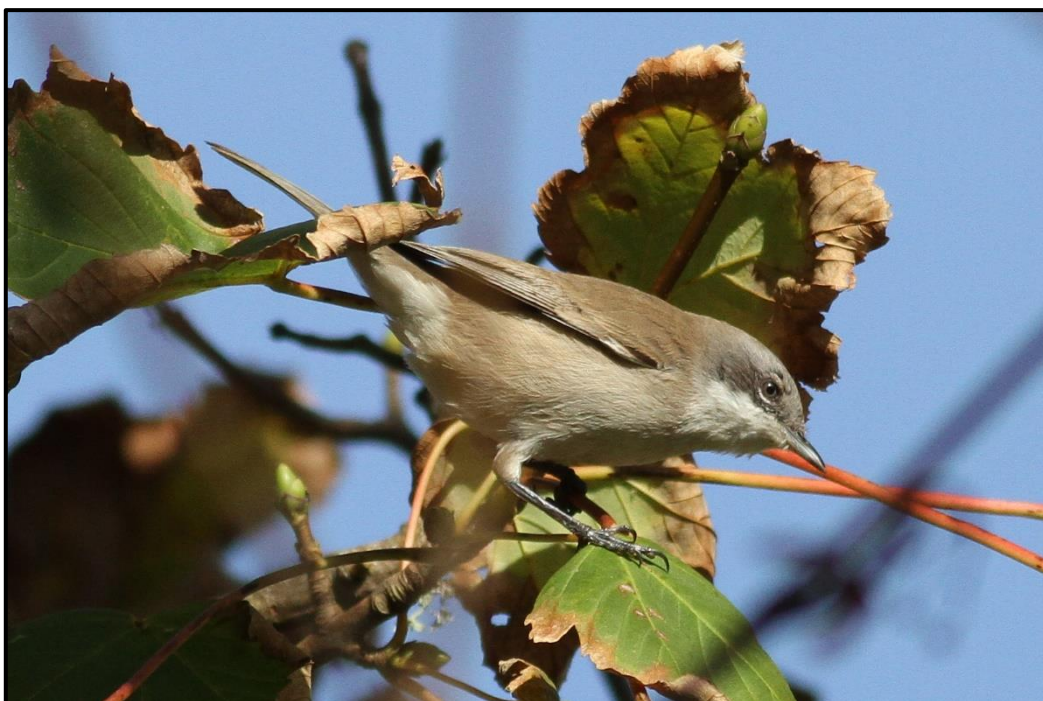
Fauvette babillarde orientale ( Sylvia curruca blythi ) – Cimetière Ouessant / Finistère (29)