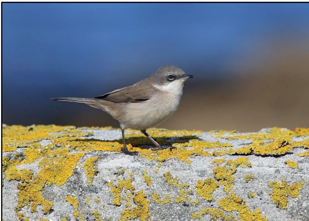
Fauvette babillarde orientale ( Sylvia curruca blythi ) – Sein / Finistère (29)

Locustelle fluviatile ( Locustella fluviatilis ) River Warbler :