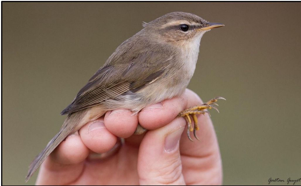
Pouillot brun ( Phylloscopus fuscatus ) – Tréogat / Finistère (29)

1 (enregistré) du 16 au 19/10 à Park Raden / Ouessant (29) (M. Celej, A. Da Silva et al. ).