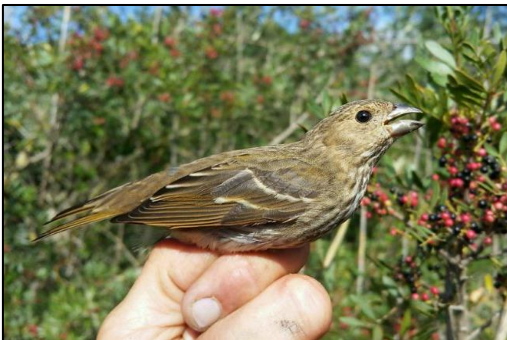
Roselin cramoisi ( Erythrurus erythrurus ) – Hyères / Var (83)