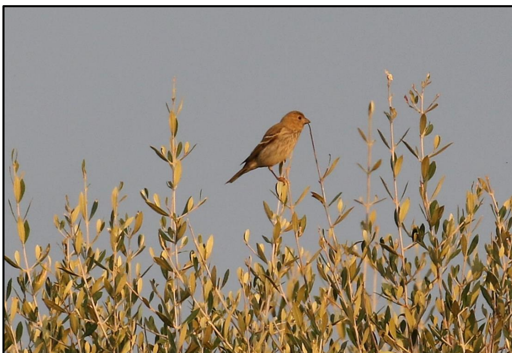
Roselin cramoisi ( Erythrurus erythrurus ) – Barcaggio / Haute-Corse (2A)

1 1A (phot. et enregistré) au-dessus du vallon d'Arland / Ouessant (29) (P. Dufour, A. Reboul, F. Veyrunes et al. ) ; 1 1A (phot.) à Punel / Ouessant (29) le 21/10 (C. Haag et al. ) ; 1 (enregistré) le 30/10 au Cromlec'h / Ouessant (29) (S. Wroza). De nouveau un joli triplé pour Ouessant !