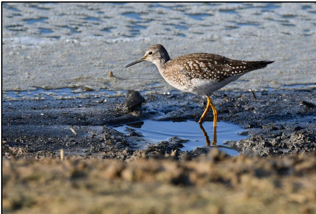
Chevalier à pattes jaunes ( Tringa flavipes ) – Nangis / Seine-et-Marne (77)

1 1A (phot.) du 06 au 14/10 à Herbignac (44) (J.-M. Vailhen et al. ) et 1 1A (phot.) à partir du 26/10 à Nangis (77) (C. Bray et al. ).