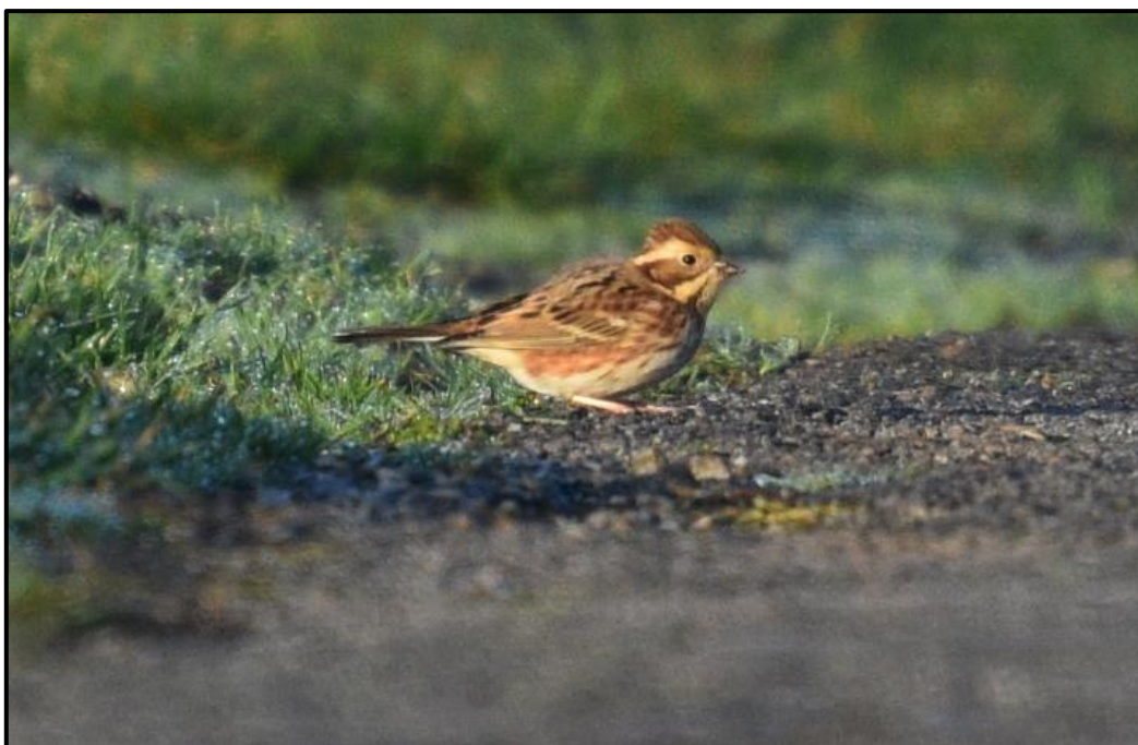
Bruant rustique ( Emberiza rustica ) – Punel Ouessant / Finistère (29)