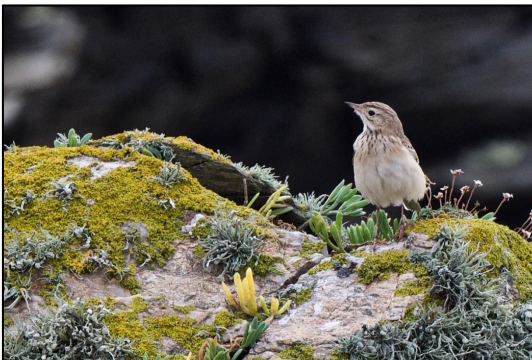
Pipit de Godlewski ( Anthus godlewski ) Individu n°1 – Ouessant / Finistère (29)

2 oiseaux de premières années ensemble (phot. et enregistrés) à partir du 18/10 (H. Touzé, R. Seitre, S. Havet et al. ) rejoint par un troisième individu le 21/10 uniquement (F. Veyrunes, J. Renoult et al. ) puis au minimum un seul du 25 au 29/10 à Porz Doun / Ouessant (29). Effectif exceptionnel en Europe de l'ouest, les oiseaux cantonnés sur un secteur restreint auront permis de belles observations en compagnie parfois directe de bruants lapons et d'un Pipit à gorge rousse.