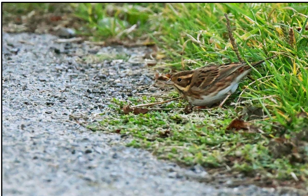
Bruant rustique ( Emberiza rustica ) – Arland Ouessant / Finistère (29)