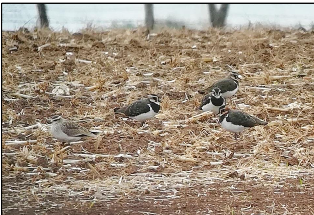
Vanneau sociable ( Vanellus gregarius ) – Assenoncourt / Moselle (57)

1 le 10/10 à Radonvilliers (10) (T. Jourdain) ; 1 (phot.) du 12 au 27/10 à Alteviller / Tarquimpol (57) et Assenoncourt (57) (M. Poumarat, F. Poumarat et al. ) ; 1 (phot.) le 16/10 aux Champarts / Rolleboise (78) (R. Jugieux) ; 1 (phot.) les 23 et 26/10 à l'étang de Beaurepaire / Cléré-sur-Layon (49) et Saint-Maurice-la-Fougereuse (79) (P. Dufour et al. ) ; 1 (phot.) le 25/10 au Lac de la forêt d'Orient / Piney (10) (S. Gardien et al. ).